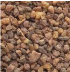
Fűben, fában orvosság / 2 órája