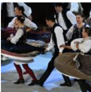
Táncházmozgalom / 47 perce